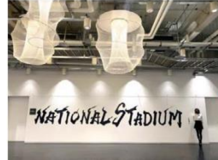
青柳美扇氏 国立競技場内展示作品