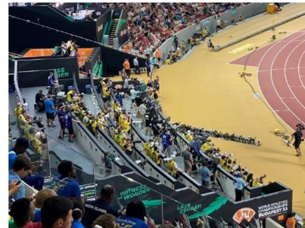
カメラ撮影用ブース イメージ