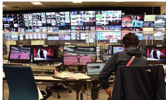
仮設ハウス内観 イメージ