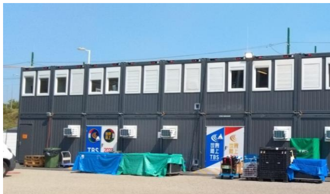
仮設ハウス外観 イメージ